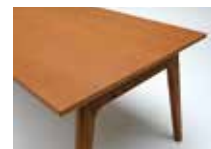
W: ホワイトアッシュ突板天板