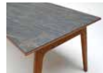
C: 大理石模様セラミック天板