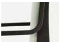
成型合板のフレームと座のシェルが一体化した構造。