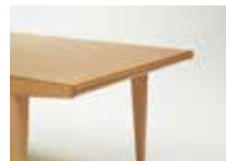
天板と一体化した木口面から、伸張式の天板を引き出す事により天板のスペースを広げることができます。