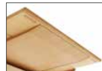
伸張式の天板はテーブルのフォルムを損なう事なく収納されており、天板裏の掘り込み加工により容易に天板を引き出す事が出来ます。