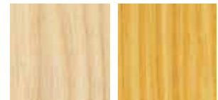
①ホワイトアッシュ