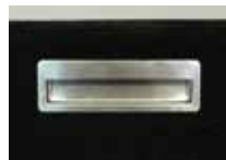
MD-101H オプションハンドル