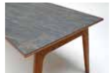
C: 大理石模様セラミック天板