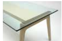
G: クリアガラス天板 (15ミリ)

W2100・D900 ガラス天板 H703 / セラミック天板・木天板 H720