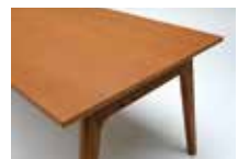
W: ホワイトアッシュ突板天板