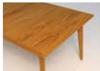
HO: チーク材無垢天板