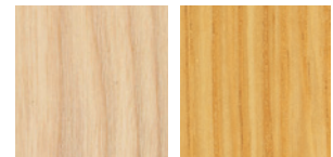
①ホワイトアッシュ

ホワイトアッシュ材のシャープな107と、面取りで手触りを良くしたオーク材の107Nをお選びいただけます。