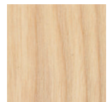
① ホワイトアッシュ

厚みを増した天板と強度断面を増した楕円形状のホワイトアッシュ材の脚によって、W1800×D900のサイズまで対応できるようになりました。