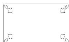
AD-152 (150) W1500-D900-H700 (t.35)