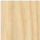
①ホワイトアッシュ

ミニマリズムを追求した、シンプルなダイニングテーブルです。脚部は厚み45ミリのホワイトアッシュ材。対角線状に向いた脚部は、 面と面・曲線とテーパー処理の組み合わせにより、贅肉をそぎ落とした構造にテーブルとしてのデザイン性を加味しています。