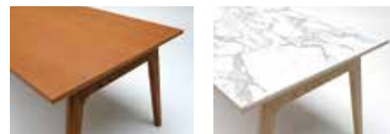
W: ホワイトアッシュ突板天板